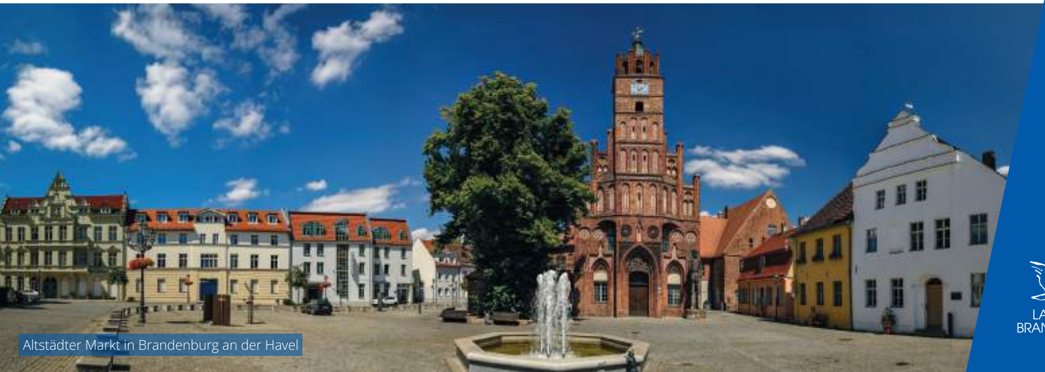
Altstädter Markt in Brandenburg an der Havel

Strategische Ansätze auf europäischer und globaler Ebene sollten mit langfristigen Entwicklungspolitiken auf regionaler Ebene verbunden werden, da die Folgen dieser Herausforderungen auf regionaler Ebene entstehen und dort am besten ortsbezogen (place-based) adressiert werden können. Die Kohäsionspolitik sowie die GAP bieten den Regionen die Möglichkeit, ihre jeweils unterschiedlichen Transformations- oder (Struktur-) Reformbedarfe zu adressieren. Instrumente wie die Wiederaufbau- und Resilienzfazilität bieten hingegen keine regionalen Gestaltungsräume, sie sollte daher nicht fortgeführt werden.