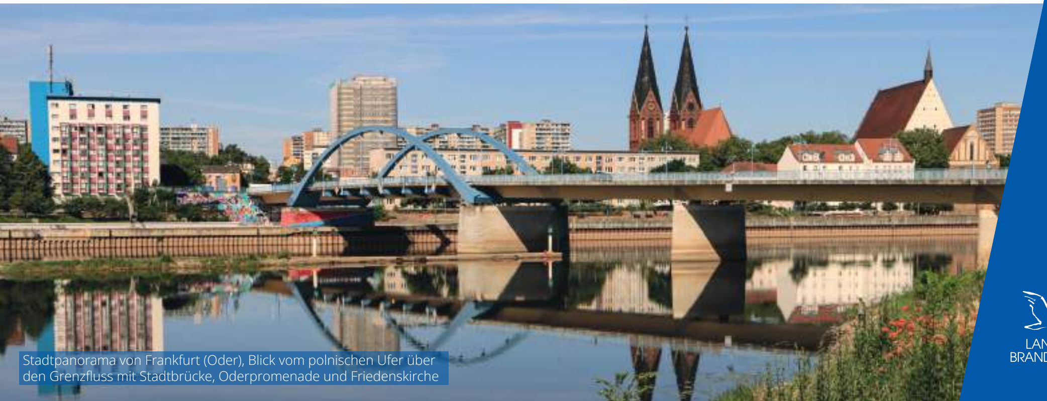
Stadtpanorama von Frankfurt (Oder), Blick vom polnischen Ufer über den Grenzfluss mit Stadtbrücke, Oderpromenade und Friedenskirche

Die grenzübergreifende, transnationale und interregionale Zusammenarbeit (INTERREG) leistet einen maßgeblichen Beitrag zur europäischen Integration, zur Förderung eines guten nachbarschaftlichen Miteinanders in Europa und zur Sichtbarkeit der EU durch die Zusammenarbeit vor Ort über Staatsgrenzen hinweg. Sie sollte fortgeführt werden und im Mehrjährigen Finanzrahmen 2028–2034 eine ihrem besonderen europäischen Mehrwert angemessene finanzielle Ausstattung erhalten.